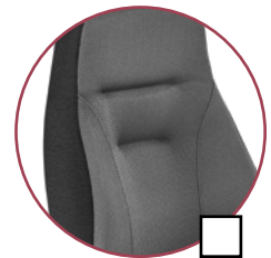
Sitz/Rücken 2463 (anthrazit) Seiten 2409 (schwarz)