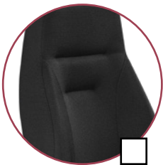
Camira Manhattan 2409 macys (schwarz)