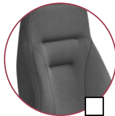
Camira Manhattan 2463 Broadway (anthrazit)