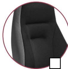
Sitz/Rücken 2409 (schwarz) Seiten 2463 (anthrazit)